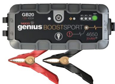
Art. nr 9440020