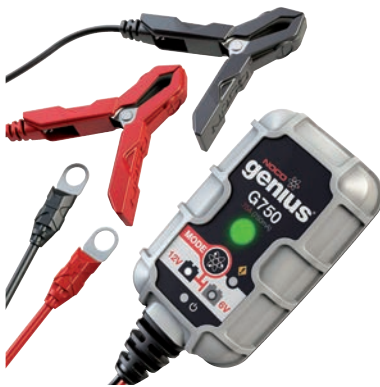
Art. nr 9450075