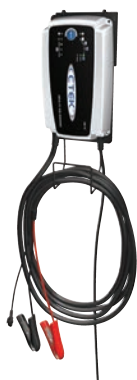
Art. nr 9451015

Alla CTEK batteriladdare är elektroniksäkra, gnist-, felkopplings- och kortslutningssäkra.