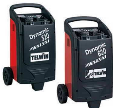
Art. nr 9457130 Art. nr 9457132