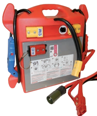
Art. nr 9444746