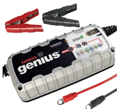
Art. nr 9452600