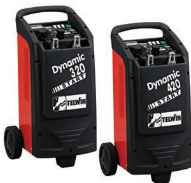
Art. nr 9457125 Art. nr 9457126