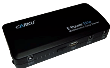
Art. nr 9441190