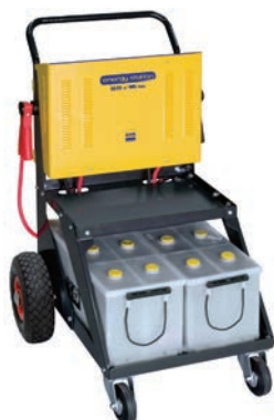
Art. nr 9442512

OBS! Batterier ingår ej! Kabel med mässingklämmor.