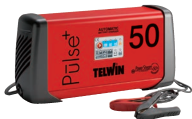
Art. nr 9457103