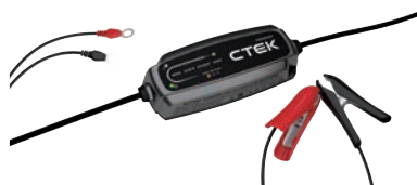
Art. nr 9452045

Alla CTEK batteriladdare är elektroniksäkra, gnist-, felkopplings- och kortslutningssäkra.