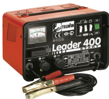
Art. nr 9457120