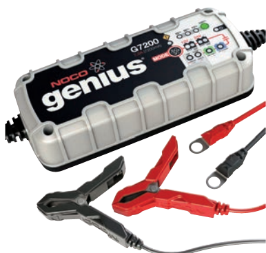
Art. nr 9450720