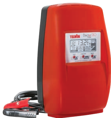
Art. nr 9457104