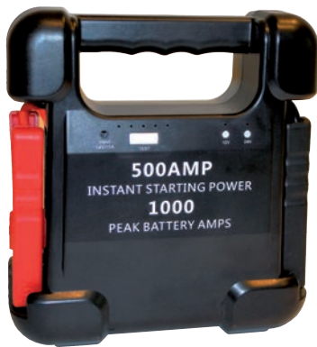
Art. nr 9441224