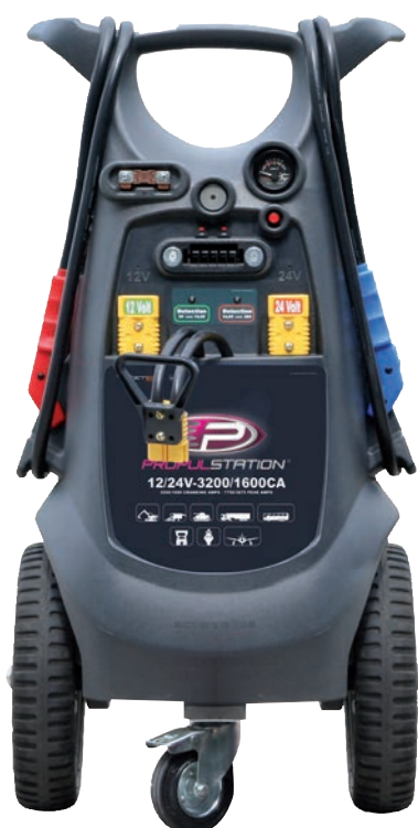
Art. nr 9447780