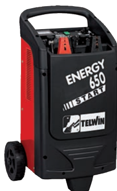
Art. nr 9457135