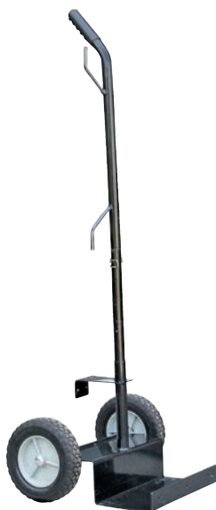
Art. nr 9444742