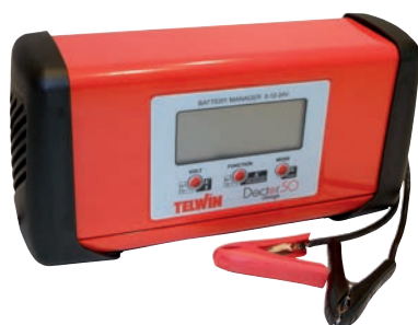
Art. nr 9457102