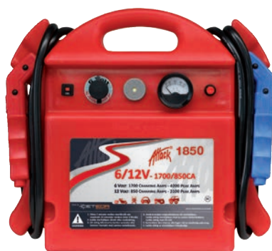
Art. nr 9441850