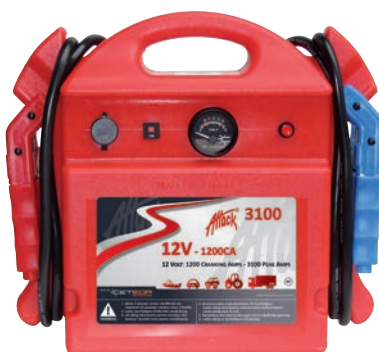
Art. nr 9443100