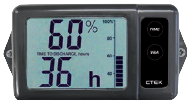
Art. nr 9452080

Alla CTEK batteriladdare är elektroniksäkra, gnist-, felkopplings- och kortslutningssäkra.