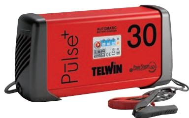
Art. nr 9457107