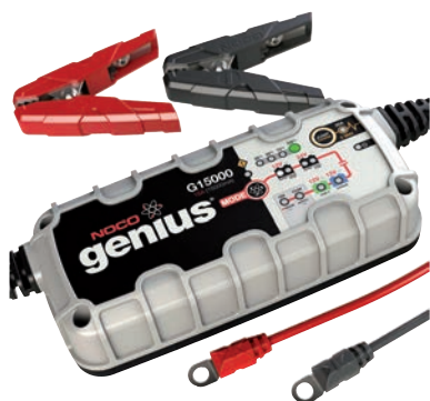
Art. nr 9451500