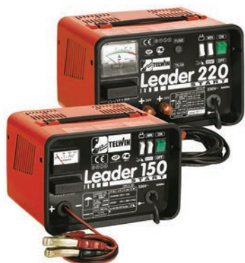
Art. nr 9457116 Art. nr 9457115