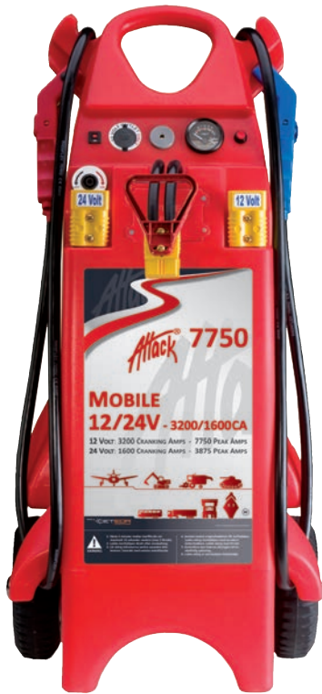
Art. nr 9447750