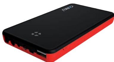
Art. nr 9441180