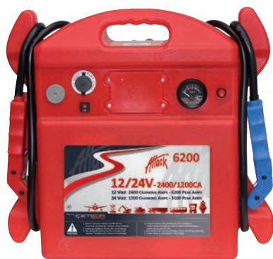
Art. nr 9446200