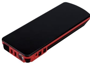
Art. nr 9441210

Är utrustad med ledlampor för att lätt kunna avläsa statusen på startboostern, för att alltid ha den fulladdad och redo att hjälpa. Startboostern har även en stark lampa med ett blinkade (sos)-ljus för att påkalla uppmärksamhet samt ett fast starkt sken för att underlätta i en nödsituation. Samtliga Car Jumpstarter har en 3-funktioners LED-lampa. Levereras i konstläder-etui med start kablar.