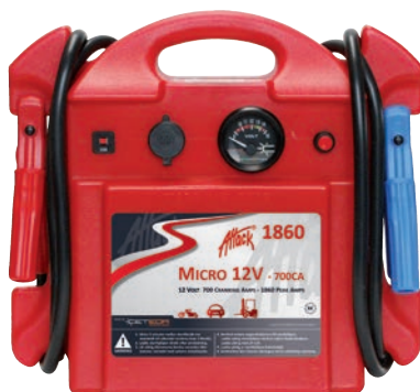
Art. nr 9441860