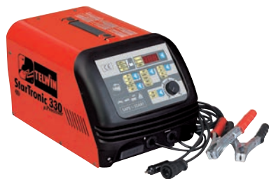
Art. nr 9457140