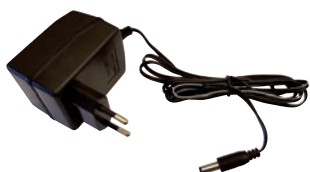
Art. nr T169691