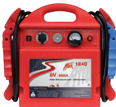
Art. nr 9441840