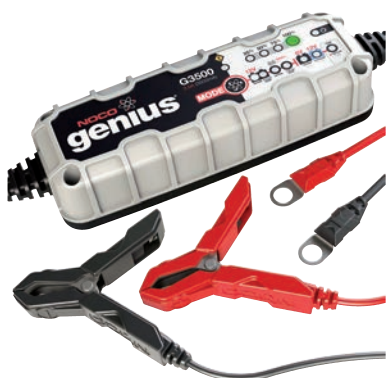
Art. nr 9450350