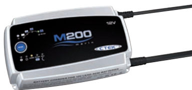
Art. nr 9451050