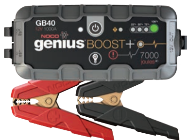
Art. nr 9440040