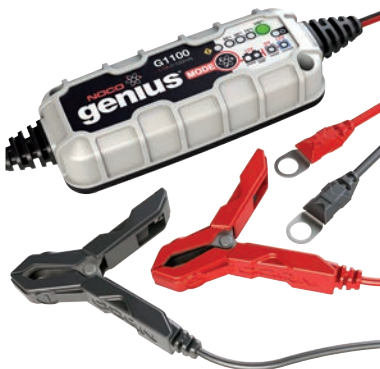
Art. nr 9450110