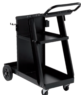
Art. nr T803074