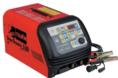
Art. nr 9457150

StarTronic 530 för våta, gel och NiCD batterier.