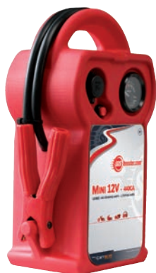
Art. nr 9441440