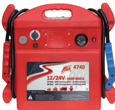
Art. nr 9444740