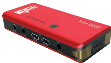
Art. nr T829566