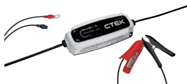
Art. nr 9452040