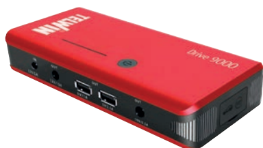
Art. nr T829565